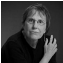
Rae ARMANTROUT Poète, Professor of Poetry and Poetics, University of California, San Diego